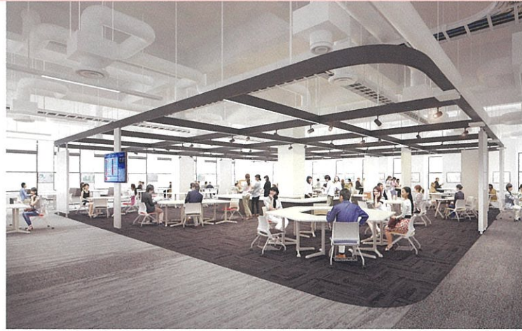
【ラーネット記念図書館 ラーニング・commons】 協同学習やアクティブラーニング等、多種多様な学びの交流を展開するエリアです。

①【プレゼンテーションコート】 机を撤去して全面を使用すれば講演会の開催も。(70席) ワイドスクリーンを使つてのプレゼンテーションもOK。 オープンなスペースなので、周りの人も巻き込みながら、 様々な形態のイベントが開催できます。