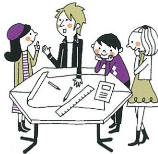
机を組み合わせて いろいろな形で グループワークができます

④【グループワークエリア】 数人から十数人ほどの、肩肘張らないリラックスした小セミナー 会場にセッティングできます。プロジェクターや天井のフレーム を使ってポスターセッションもできます。